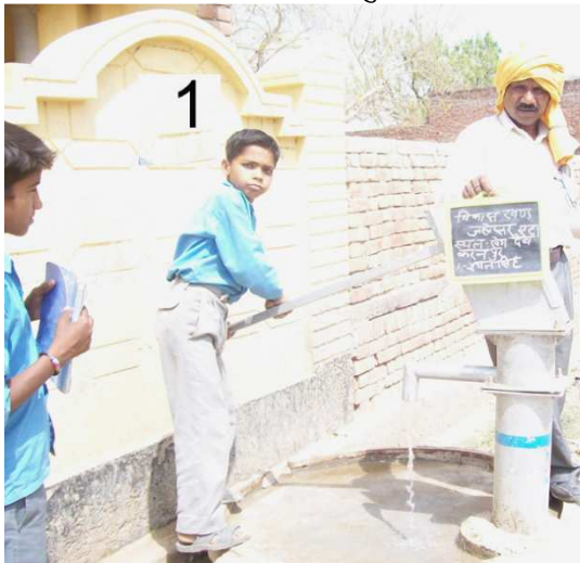
ग्राम – खेडा देवकरनपुर