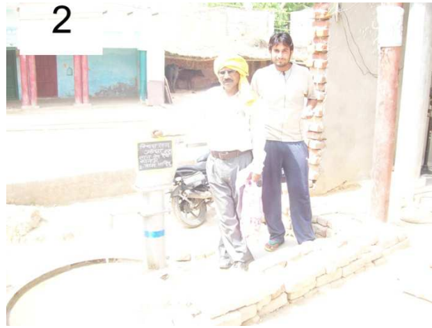
विकास खण्ड – जलेसर